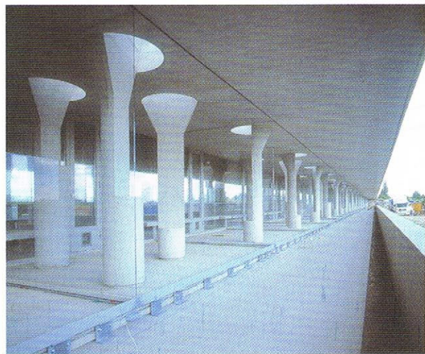
Sichtbeton als gestalterisches Element gewinnt an Bedeutung.

Selbstverdichtende und leichtverdichtbare Betone brauchen das „frisch in frisch“ ineinander Fließen, damit sich keine Schüttilagen herausbilden. Somit ist der Einbau mit der Pumpe die technisch sinnvolle Lösung.