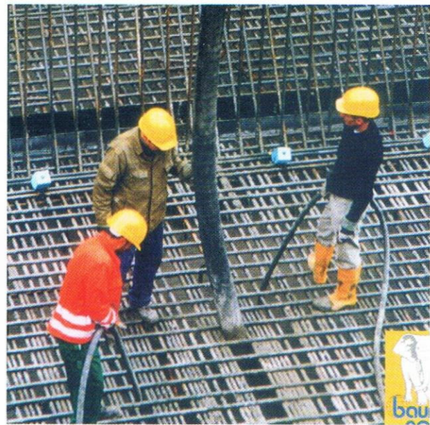
Pumpbeton, die clevere Lösung für die Baustelle.

Das richtige Zusammenspiel von Betonanlieferung, Pumpe und Einbaumannschaft reduziert die Zeit, in der die Baustellenzufahrt durch Fahrmischer blockiert wird. Das bedeutet weniger Stress mit den Anwohnern und Verkehrsteilnehmern. Auch Konflikte mit Anlieferern anderer Gewerke, die an den Fahrmischern vorbei nicht zur Baustelle gelangen können, werden so auf ein Minimum reduziert.