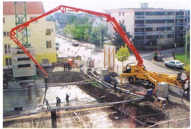
Die fachgerechte und zügige Verarbeitung des Frischbetons sorgt für eine gleichbleibende Bauteilqualität.

blem nicht. Im Gegenteil: Nachträgliche Wasserzugabe verschlechtert die Betonqualität erheblich und muss vermieden werden.