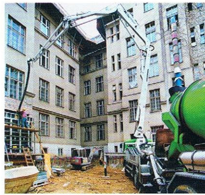
Beim Bauen im Bestand häufig die geeignete Lösung: Pumpbeton.

oder eine schlecht erreichbare Etage – der Schlauch der Betonpumpe, über den der Beton verteilt wird, erreicht fast jeden Winkel.